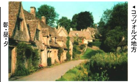
◀コッツウォルズ地方