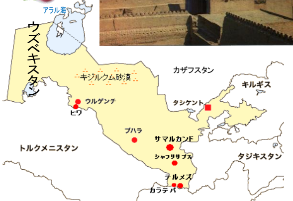
ご利用予定ホテル(取れない場合もございます)