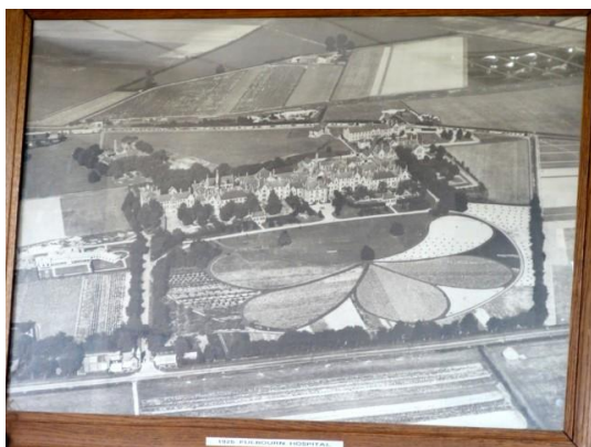
1926 年フルボーン精神病院

今回はイギリス・ケンブリッジにあります旧フルボーン精神病院跡地の施設で、シェパード先生にお話しいただいた内容のご報告となります。