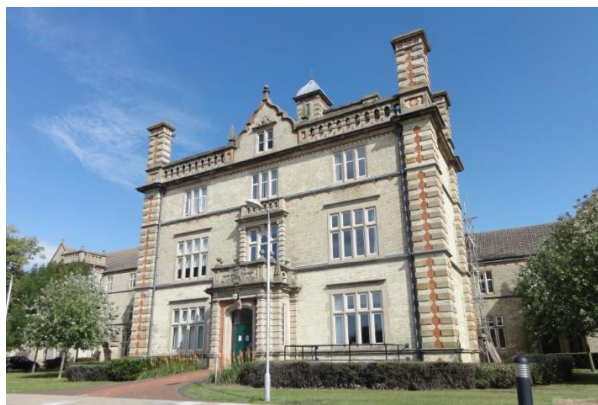
旧フルボーン精神病院 (現在は NHS が使用)