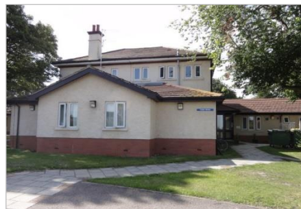
シェダーリカバリーユニット