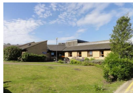
アドリアンハウス

以前は精神保健(医療)とソーシャルケアは分離していました。繰り返しになりますが精神保健は NHS の方で、資金は国から地方当局に流れ各地の精神保健局から各組織に支給されています。ソーシャルケアは地方自治体の責任という事で地方自治体が賄っていくという事です。この様に財源も違いますしサービス提供の仕方も分かれています。しかしこの流れが変わって精神保健(医療)とソーシャルケアが統合されてきました。これは地方自治体において精神保健のサービス担当とソーシャルケアのサービス担当が一緒に共同で考えていくという様になりました。地方によっては精神保健サービスとソーシャルケアサービスの担当が同じ人で、2つの財源から雇われ給与が支払われている場合もあります。