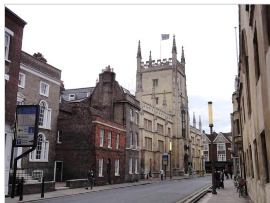
ケンブリッジの風景